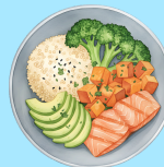
Ovnsbakt laks og ris/potet