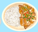
Kylling og ris/potet